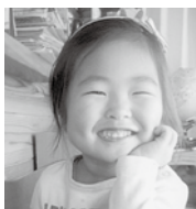
鈴木ころちゃん (街道)