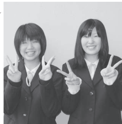
秋田西高校 生徒会