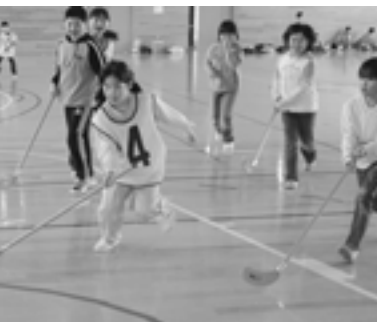
ユニバーサルホッケー教室