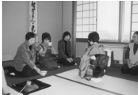
お茶を楽しむ「茶道教室」