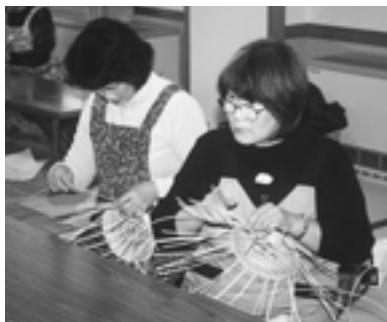
生きいき女性セミナー