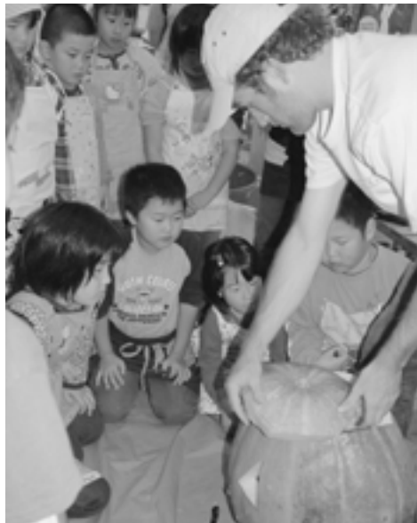
キッズクラブ/ハロウィーンのお面づくり