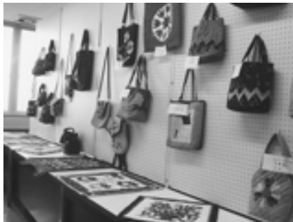
文化祭展示コーナー / パッチワーク教室