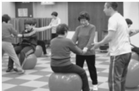
健康づくり教室/バランスボールエクササイズ