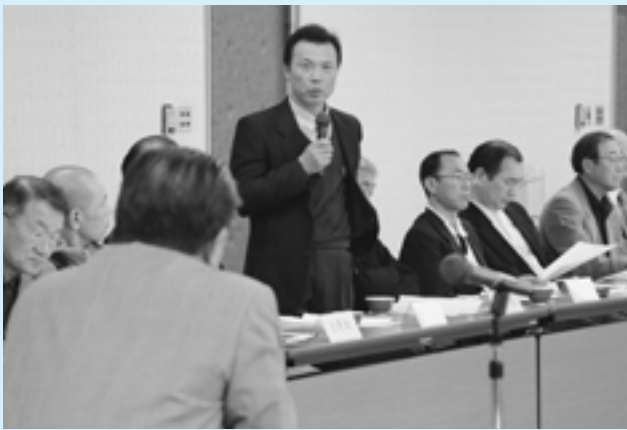
平成 18 年度 町内会長会役員