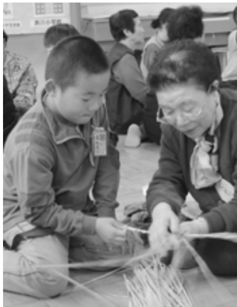
高齢大学/小学生との「しめ縄づくり」