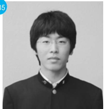
秋田西高校 吹奏楽部