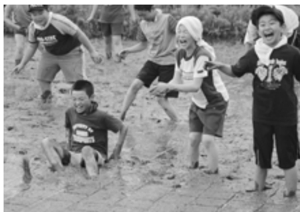
泥に足を取られて尻もちのハプニングも

あいにくの小雨が降る肌寒さの中、井川小5年生による田植え体験が行なわれ、生徒たちは素足の泥の感触に「冷たい」と元気な声をあげながら、苗の一株々々を植えていきました。