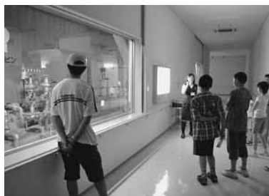
△溶融処理時に発生する水蒸気を循環させて電力にして施設全体の電気をまかなう。一般家庭2万世帯分相当

ごみを溶融処理するメリットは処理の過程で発生するスラグやメタル、ガス等を再資源化および再利用できること。例えばメタルはなまり金属に、スラグ