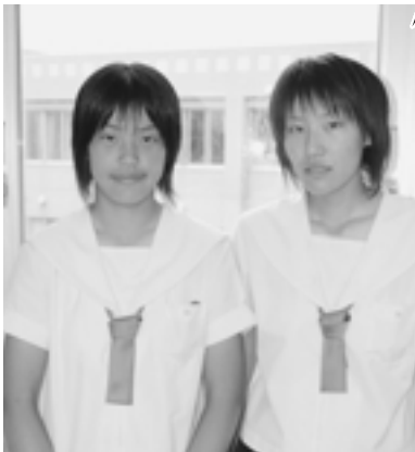
秋田南高校 軟式テニス部