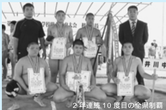
2年連続10度目の全県制覇