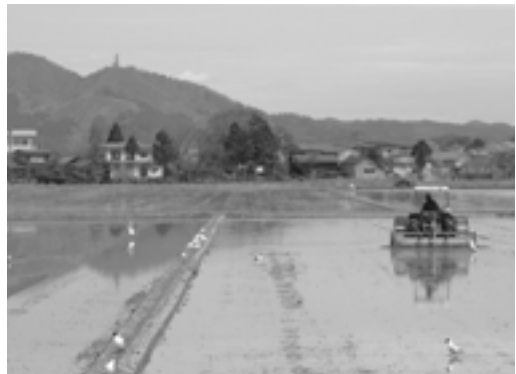
【農地等に関することは】