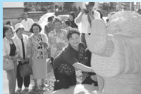
作品名：けやきんぼうの仲間たち 設置場所：旧羽立分館前・大ケヤキ下