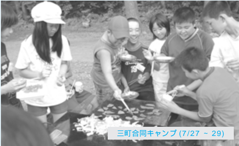
三町合同キャンプ (7/27 ~ 29)