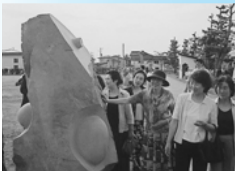
作品名：湖 人（こびと） 設置場所：浜井川グラウンド地内

また会場に足を運んでくださった町内外のみなさん本当にありがとうございました。この後も、美しいまちのシンボルとして、彫刻たちに親しんでいきたいですね。