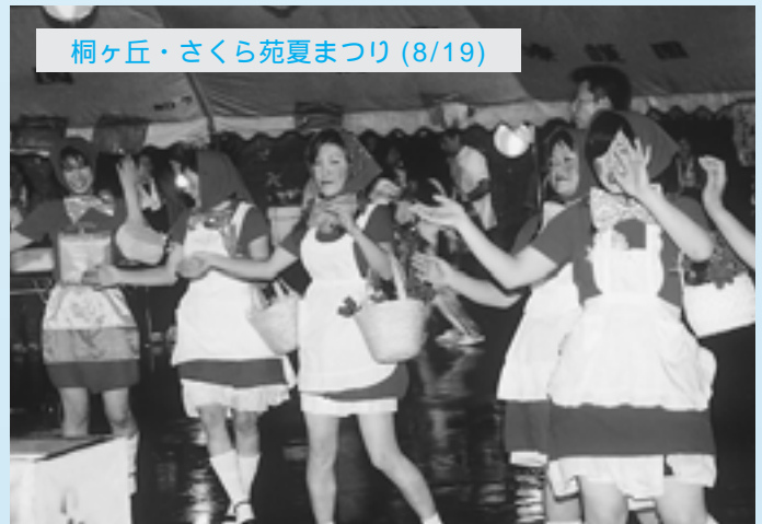
桐ヶ丘・さくら苑夏まつり (8/19)