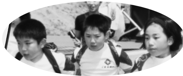
真剣な眼差しで「ソーラン節」を踊る井川小学校3年生。

町内の児童・園児等100名余が参加。思い思いの動物を描いたあとラッカーズプレーで固めて苑内に展示しました。