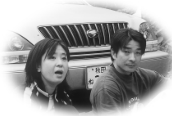
ご夫婦で参加(秋田市) 2回目。完歩の充実感がいい。ここから(第2チェックポイント)が大変。入念に足の手入れをしてがんばります。