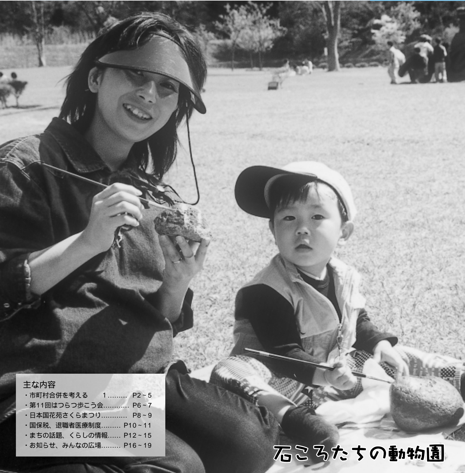
石ころたちの動物園