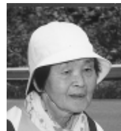
最高齢者(80歳 五城目町) 10回目の完歩です。(すごいですね。と言うと)自分のペースで歩いていますから。可能限り参加します。