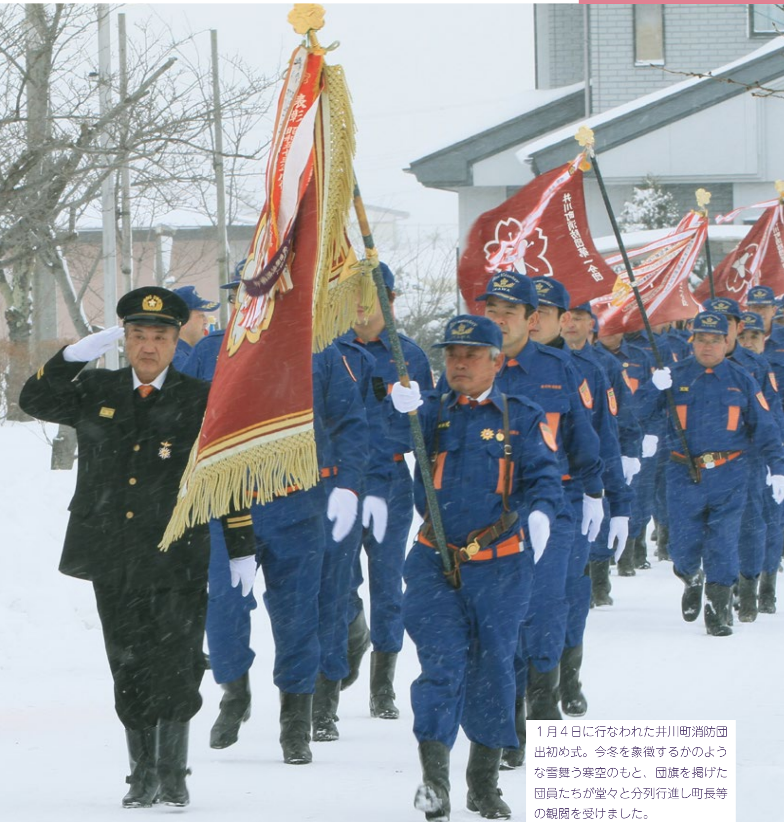
1月4日に行なわれた井川町消防団出初め式。今冬を象徴するかのような雪舞う寒空のもと、団旗を掲げた団員たちが堂々と分列行進し町長等の観閲を受けました。