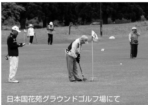
日本国花苑グラウンドゴルフ場にて