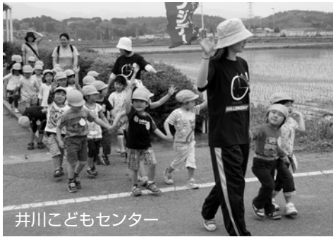
井川子どもセンター

ご参加いただいたみなさん、町内会役員をはじめ、ボランティアスタッフのみなさん、ご協力いただきありがとうございます。