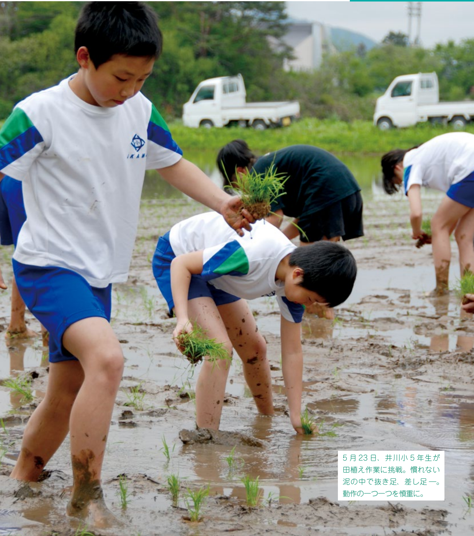
5月23日、井川小5年生が田植え作業に挑戦。慣れない泥の中で抜き足、差し足一。動作の一つ一つを慎重に。