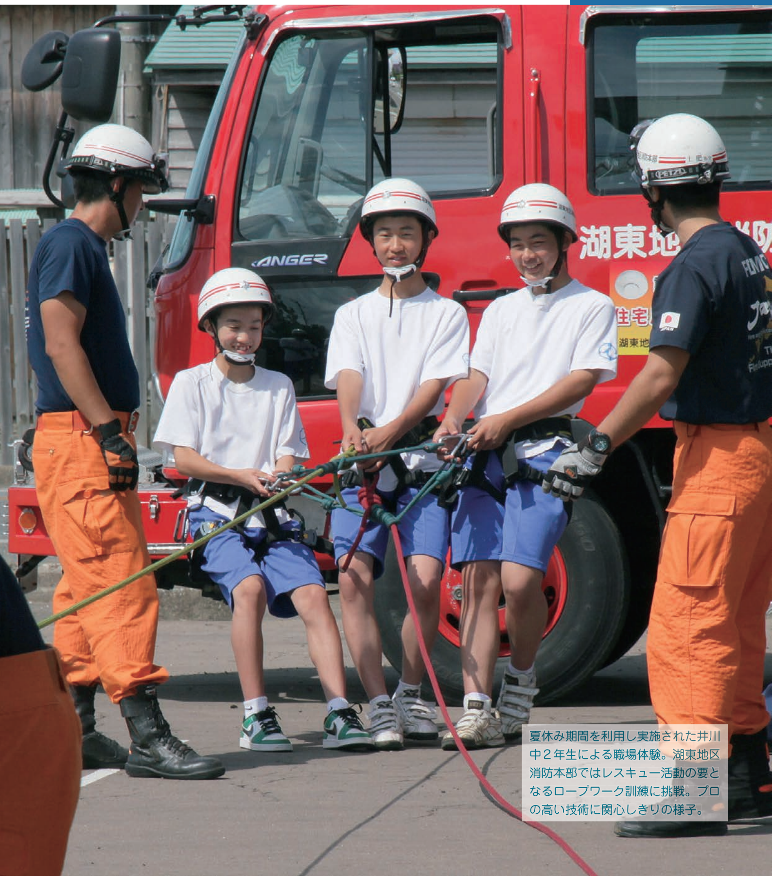
夏休み期間を利用し実施された井川中2年生による職場体験。湖東地区消防本部ではレスキュー活動の要となるロープワーク訓練に挑戦。プロの高い技術に関心しきりの様子。