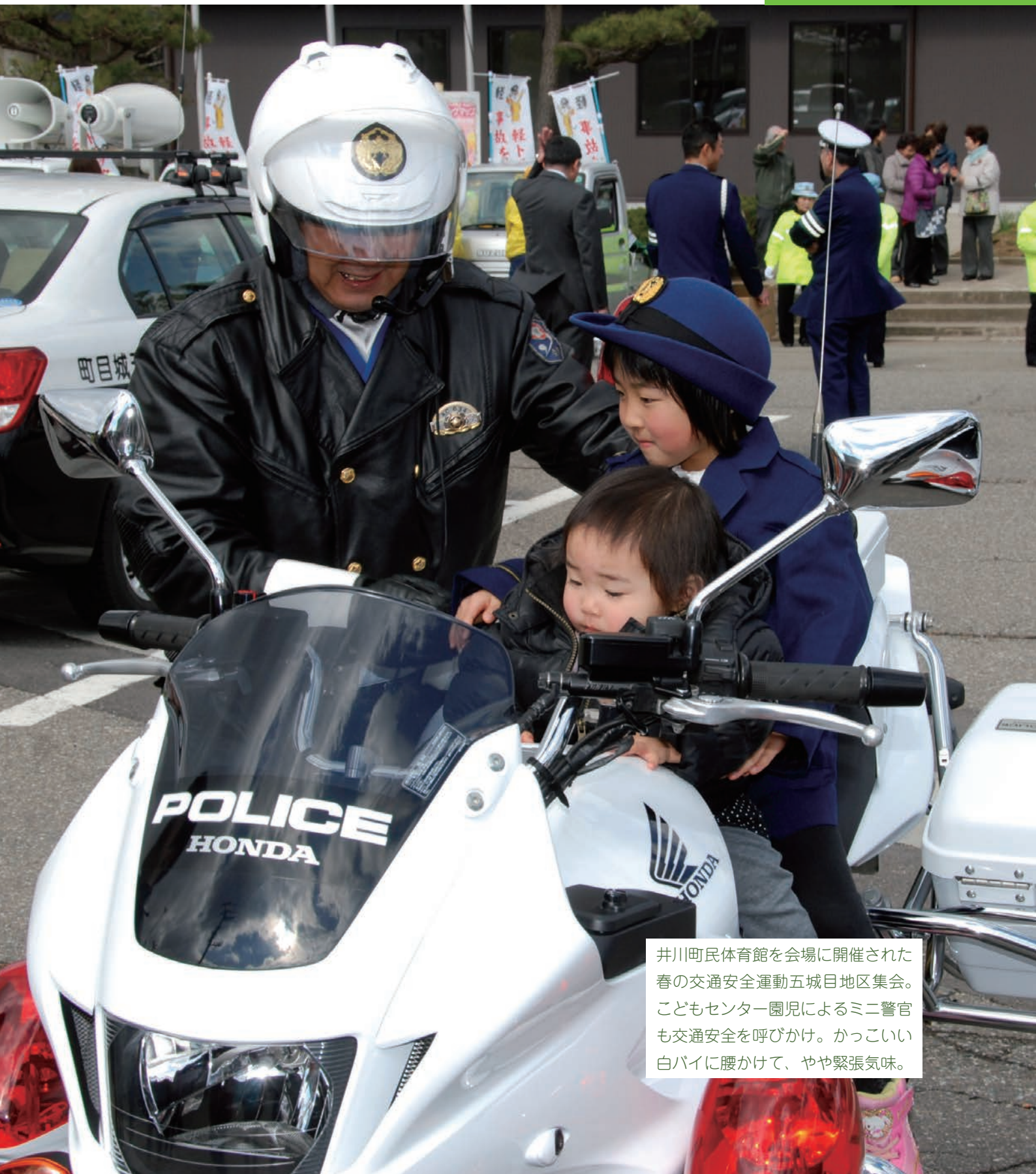
井川町民体育館を会場に開催された春の交通安全運動五城目地区集会。こどもセンター園児によるミニ警官も交通安全を呼びかけ。カッコいい白バイに腰かけて、やや緊張気味。