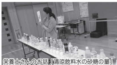
栄養士さんのお話「清涼飲料水の砂糖の量」