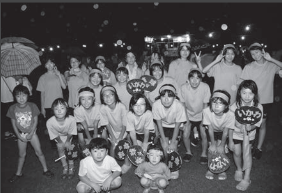
□「子どもの部／最優秀賞」 「ありのままの卓球スポ少」 (卓球スポ少21名)

8月17日、日本国花苑芝生広場を会場に「全町盆踊り大会」が開催され、老若男女約200人の参加者たちが夏の夜の踊りに集いました。 当日は時折、小雨がぱらつくあいにくの天候での実施となりましたが、町内会や地域婦人会、クラブ活動など様々な仲間たちが、この日に合わせた手づくり衣装を準備。艶やかなものから時の流行をとり入れたユニークなものまで趣向を凝らした衣装を身にまとい、踊りを楽しんでいました。