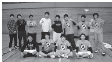
1部優勝 わらじーず