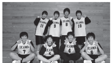
2部優勝 井川中女子バスケット部