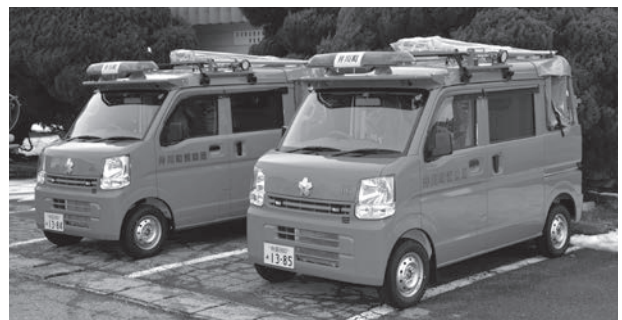
町消防団第5分団と第6分団に新しいポンプ付軽積載車が配備されました。