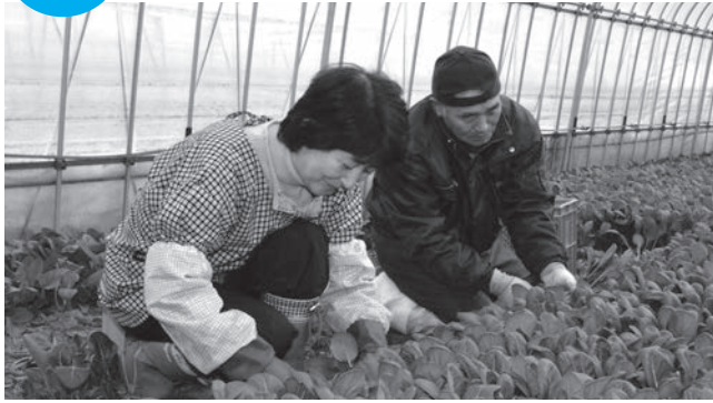
今が旬の小松菜を収穫中(つかまファーム)