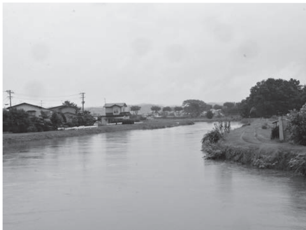
△ 23日午前9時頃の井川（井川橋から上流を撮影）

数年に一度程度しか発生しない短時間での大雨が、最近では全国各地で発生しています。以前に全戸配布しました「井川町地域防災計画（概要版）」を地域やご家庭で、いま一度確認し、避難場所等をチェックしておきましょう。