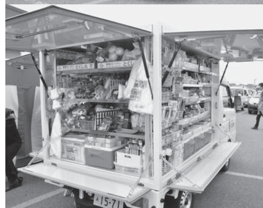
▲見守り活動を行いながら町内を巡回する移動スーパーの車両

移動スーパーは、移動販売用に改造された軽トラックに、食品から日用品まで約700アイテムを積載し、音楽を流しながら登録会員の自宅先に伺います。最初のお客さんにお話を伺うと、「普段は、息子夫婦が買い物をしてきているが、どうしても息子夫婦が好む食材になる。自分の目で見て自分好みの食材が買えて助かる。品数も多く大変有難い。」とのこと。なお、現在、井川町内では約120世帯が会員登録しており、今後、週に1〜2回、会員宅を訪問し移動販売とともに高齢者への声掛けが行われます。