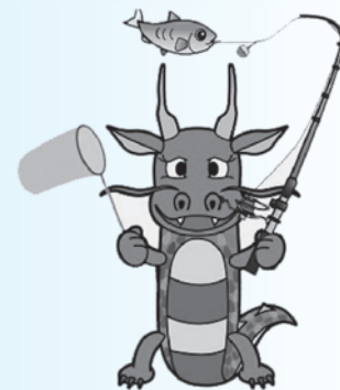
八郎湖水質保全 シンボルキャラクター 「清龍くん」

流域に暮らす住民・事業者や行政がこの長期ビジョンを共有し、その実現に向けて、一人一人が出来ることを考えましょう。