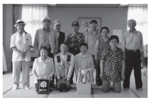
『優勝』今戸今寿会老人クラブ