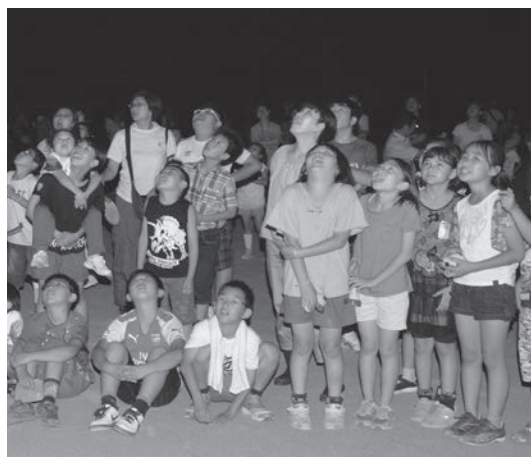
△みんな興奮気味だったけど、眠れたかな？ △線香花火などで楽しむ。打ち上げ花火もあがり、盛り上がりました！