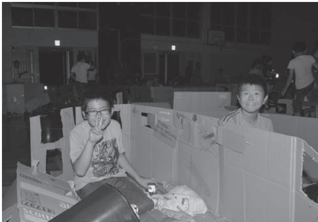
△段ボールで寝床を作り、電気のない体育館で一夜を過ごしました