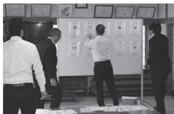
選考委員会での投票の様子