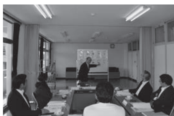
教育委員会で審議