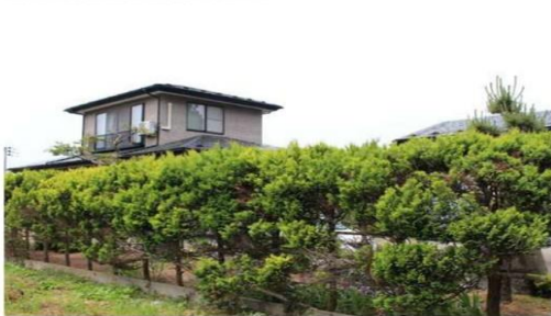
⑪南側境界植栽方向より