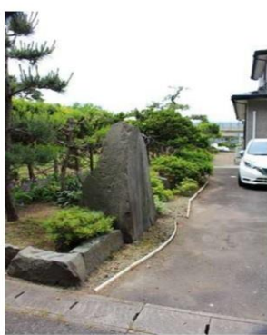
⑨入口南側庭木植栽より