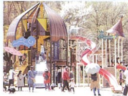
日本国花苑内の遊具