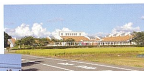
▲井川こどもセンター

保育園・幼稚園：井川こどもセンター（幼保連携型認定こども園） 小学校・中学校：井川義務教育学校（平成30年4月1日より） 子育て支援多世代交流館「みなくる」