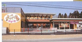
◀子育て支援多世代交流館「みなくる」