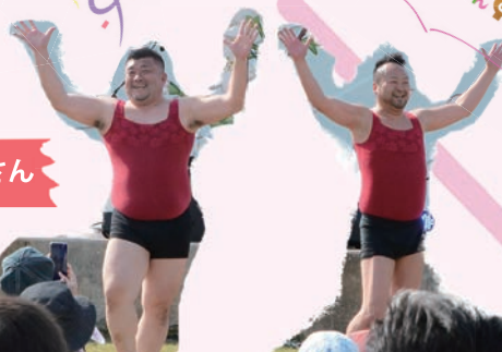
キャミソウルブラザーズさん

イベントのフィナーレには打ち上げ花火が上がり、今年も大迫力で圧巻なものでした。今年初の試みとして、レーザー光とのコラボレーション花火が上がり、夜空に煌めく2つの光に多くの方々が感動する姿がありました。