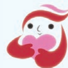
犯罪被害者等支援シンボルマーク ギョットちゃん

# 8 1 0 3 または 0 1 2 0 - 0 2 8 - 1 1 0 へおかけください。