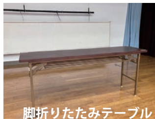
脚折りたたみテーブル