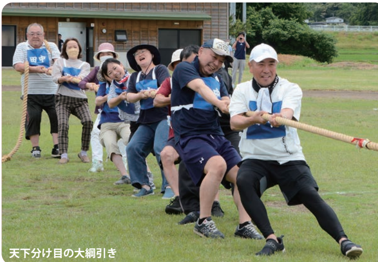
天下分け目の大綱引き