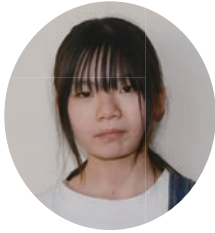
〇〇〇〇さん (今 戸)