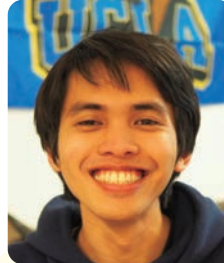
ディエゴの日記 Diego's diary