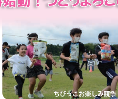
ちびっこお楽しみ競争