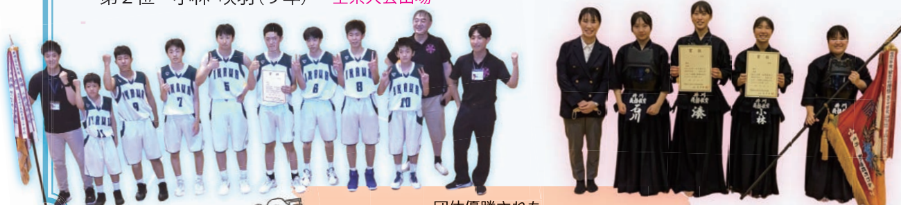
団体優勝された 男子バスケットボール部、女子剣道部の皆さん