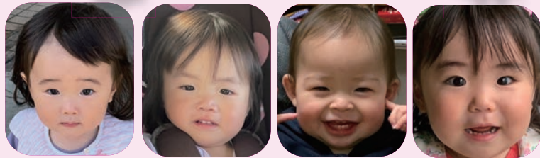
〇〇 〇〇ちゃん 〇〇 〇〇ちゃん 〇〇 〇〇ちゃん 〇〇 〇〇ちゃん (街道) (小今戸) (さくら) (羽立)