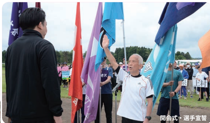
開会式・選手宣誓