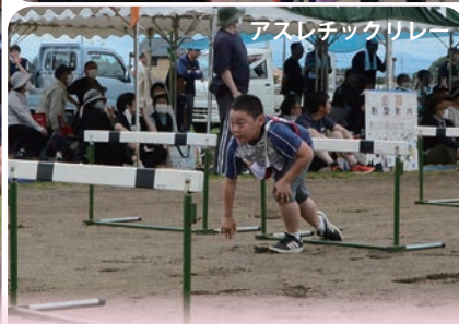
アスレチックリレー