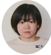
〇〇〇〇さん (羽 立)