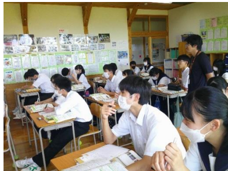
クラスに調査をして分かったことを英語で表現している9年生です。