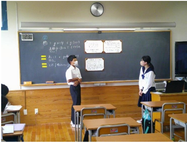
自分が導き出したことについて級友に説明している8年生です。