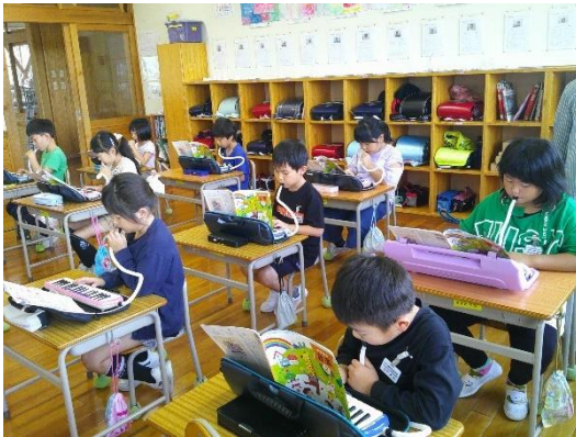
はくによって演奏する2年生です。個人で練習中です。