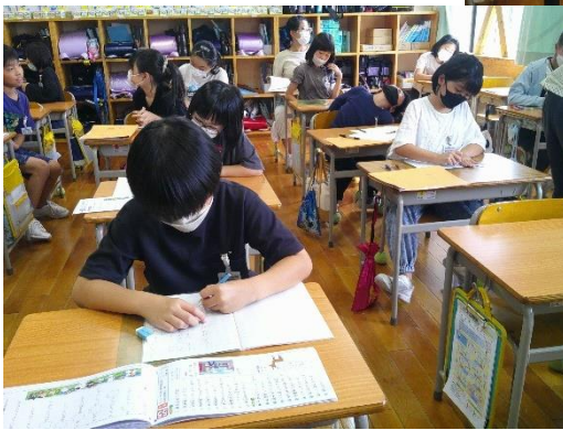
漢字のドリルやワークなどに取り組んでいる4年生です。