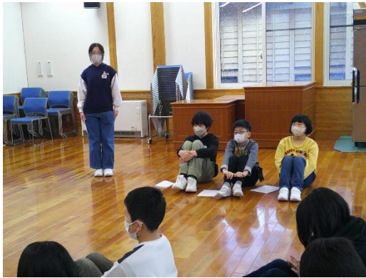
集会の開催に向けて役割を確認する5年生です