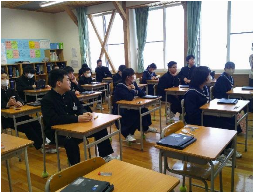
学級会で活発に意見を出し合う7年生です