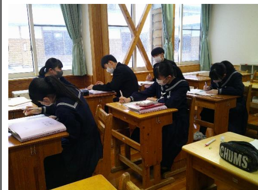
四角錐の体積や表面積を求めている9年生です