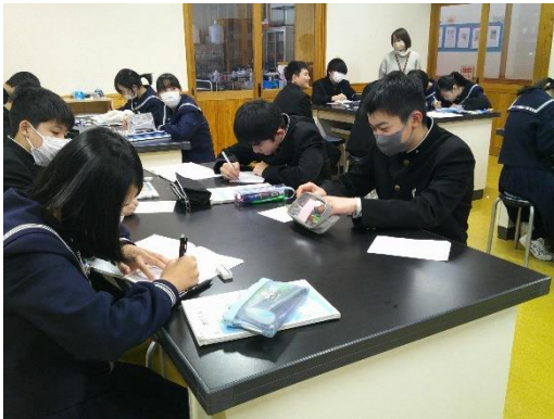
振動する弦の長さを変えることでの音の変化を学ぶ7年生です