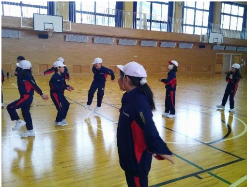
タンバリンのリズムに合わせて手をたたく2年生です