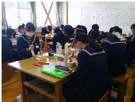
オルゴールのストッパーの取付を行う8年生です