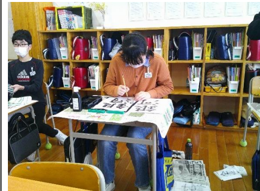
書写の時間で「銀河」に取り組む6年生です