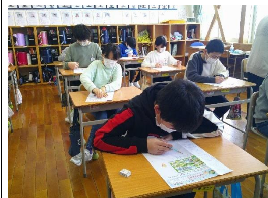
算数の割合のテスト問題を解く5年生です