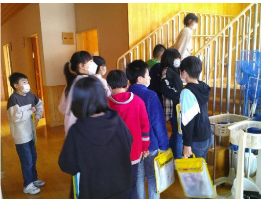
課題として出された視点を基に校内を巡る4年生です