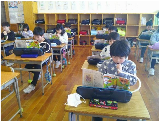
指づかいに気を付けながら演奏する2年生です