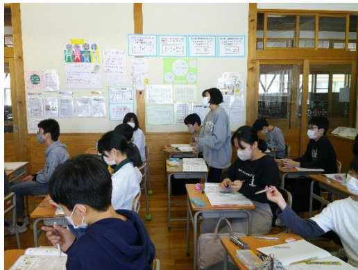
算数の課題に対して挙手をして答えていく6年生です