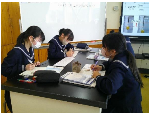
ばねの伸びと引く力の関係を学ぶ7年生です