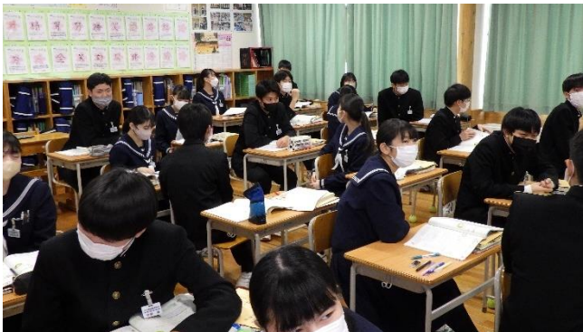
あるトピックに関して議論の要旨をまとめる9年生です