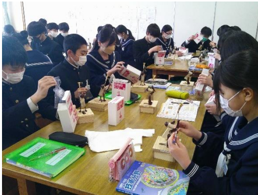
オルゴールづくりの完成を目指す8年生です