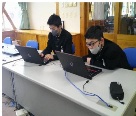
研修のレポートをまとめている7年生です