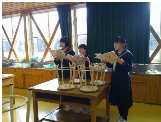
卒業式に向けての歌練習に励む9年生です