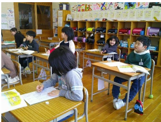
動物の赤ちゃんの違いをまとめる1年生です