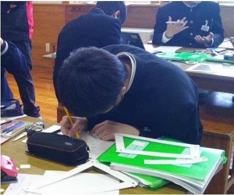
リング模型の製作に取りかかる8年生です