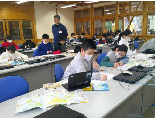
秋田県と世界の交流について調べる4年生です