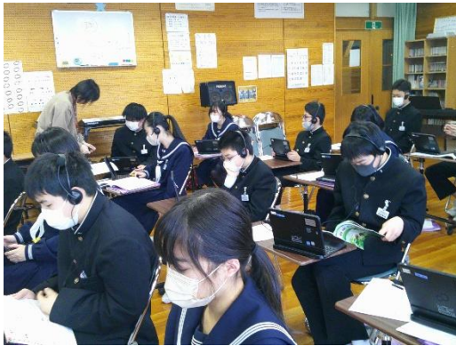
「魔王」の表現の工夫を聞き取る7年生です