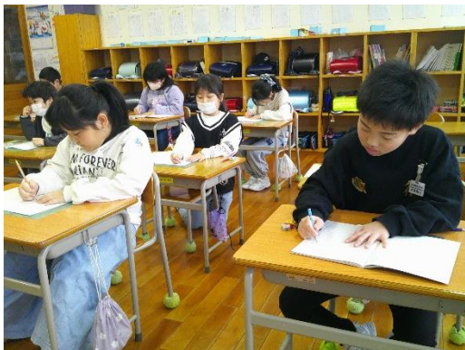
友達の発表を聞いて感想などを書く2年生です