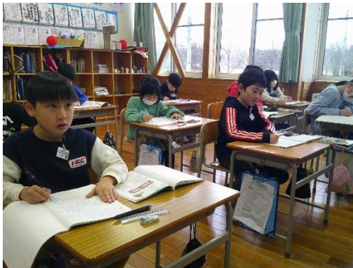
算数の文章題を式に表す3年生です