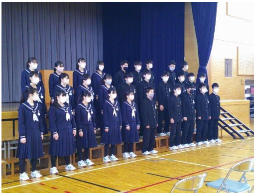
体育館で卒業式練習を行う9年生です