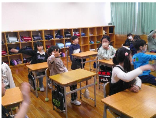
書写の授業で自己紹介の準備をする3年生です