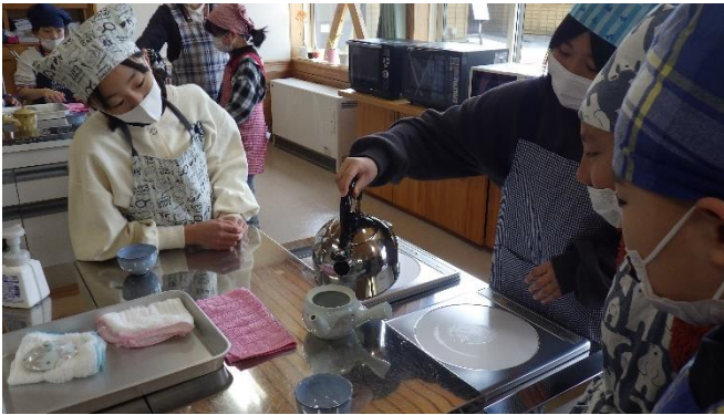
家庭科で「湯をわかそう」に取り組む5年生です