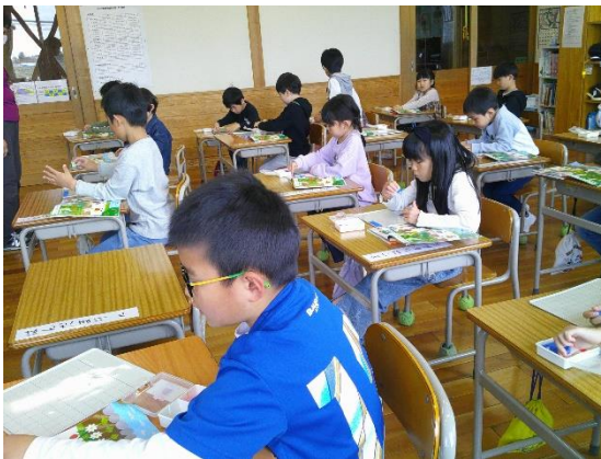
動物や植物などの仲間の数を数える1年生です