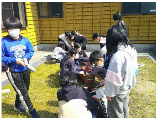
プランターにジャガイモの植え付けを行う6年生です