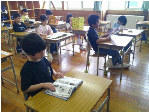
自分で選んだ絵本を読み進める1年生です