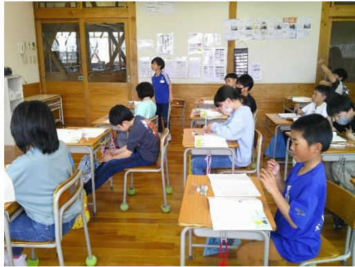
物語を読んで不思議だと思うところを発表する4年生です