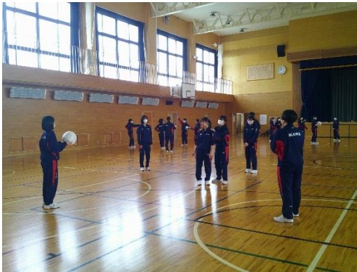
ボールを使ったアクティビティに取り組む9年生です